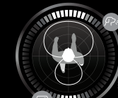
Optimisation basée sur le mouvement