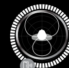
Perception spatiale DNN